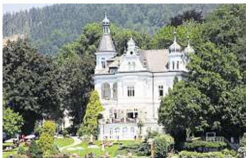
Ein Teil der Prachtbauten lässt sich auch mieten – wie die Parkvilla Wörth in Pörtschach