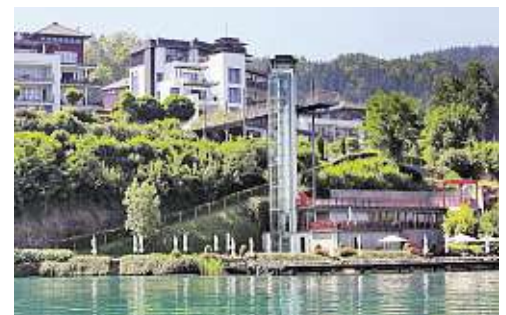
Fixe Größe am Wörthersee: das Aenea-Resort an der Süduferstraße