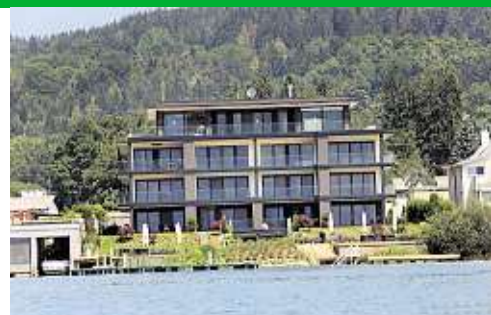
Seeresidenzen in bester Lage in Pörtschach, Anwesen mit 50 Meter Uferlänge