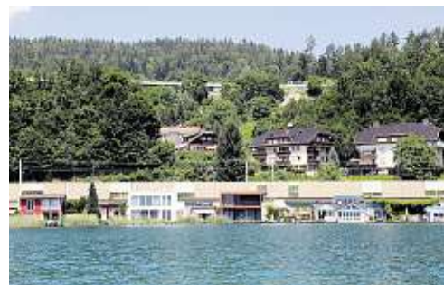
Winzige Grundstücke, aber direkt am See. Dahinter gleich die Straße und die Eisenbahn