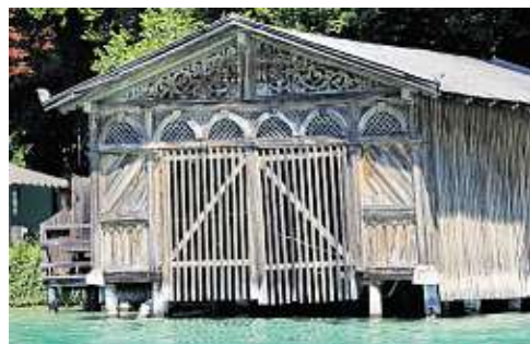
Den Traum vom Bootshaus träumen die meisten vergeblich