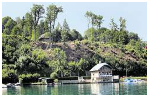
In Reifnitz werden derzeit Baugrundstücke am Hang verkauft