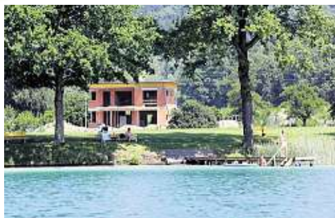
Zwischendurch zeigt sich am Nordufer immer wieder ein privater Bauplatz