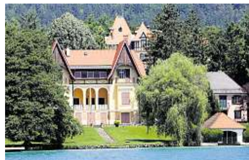
Historische Herrschaftsvilla von 1894 in Pörtschach, um etwa 9 Millionen Euro zu haben