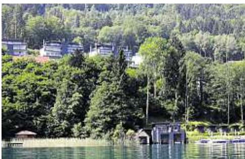
Seevillen Belvedere in Maria Wörth, etwa drei Jahre alt, über Brücke und Lift zum See