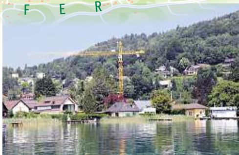
Noch sind nur die Baukräne zu sehen: Egger-Hotel und -Suiten in Krumpendorf