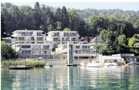
Projekt Seerose von Kollitsch-Müller nahe Velden, fertig seit Juni 2011, eine Wohnung ist noch frei