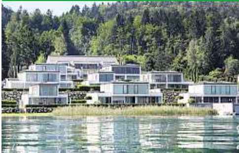
Auenhof-Resort, Baujahr 2007, an die 600.000 Euro für eine knapp 100 m 2 große Wohnung