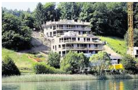
Madile-Baustelle in Dellach. Hier entstehen 16 Wohneinheiten mit eigenem Seezugang