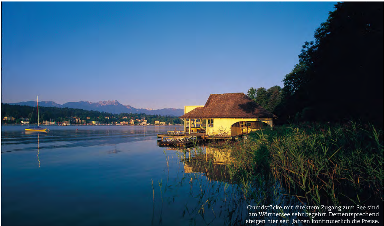
Grundstücke mit direktem Zugang zum See sind am Wörthersee sehr begehrt. Dementsprechend steigen hier seit Jahren kontinuierlich die Preise.

Zauberhafte Berg- und Seenlandschaften locken Jahr für Jahr Millionen Urlaubsgäste nach Kärnten. Verständlich, dass viele Gäste das südlichste Bundesland Österreichs als neue oder zweite Heimat wählen.