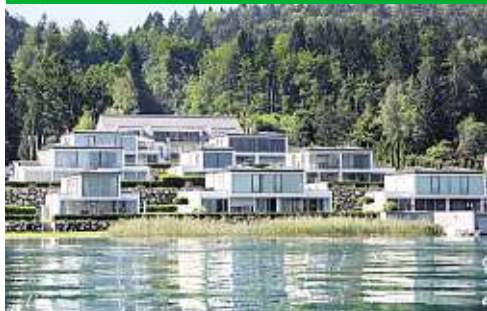
Auenhof-Resort, Baujahr 2007, an die 600.000 Euro für eine knapp 100 m 2 große Wohnung