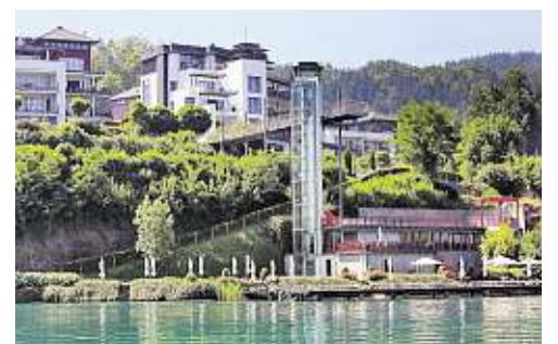
Fixe Größe am Wörthersee: das Aenea-Resort an der Süduferstraße