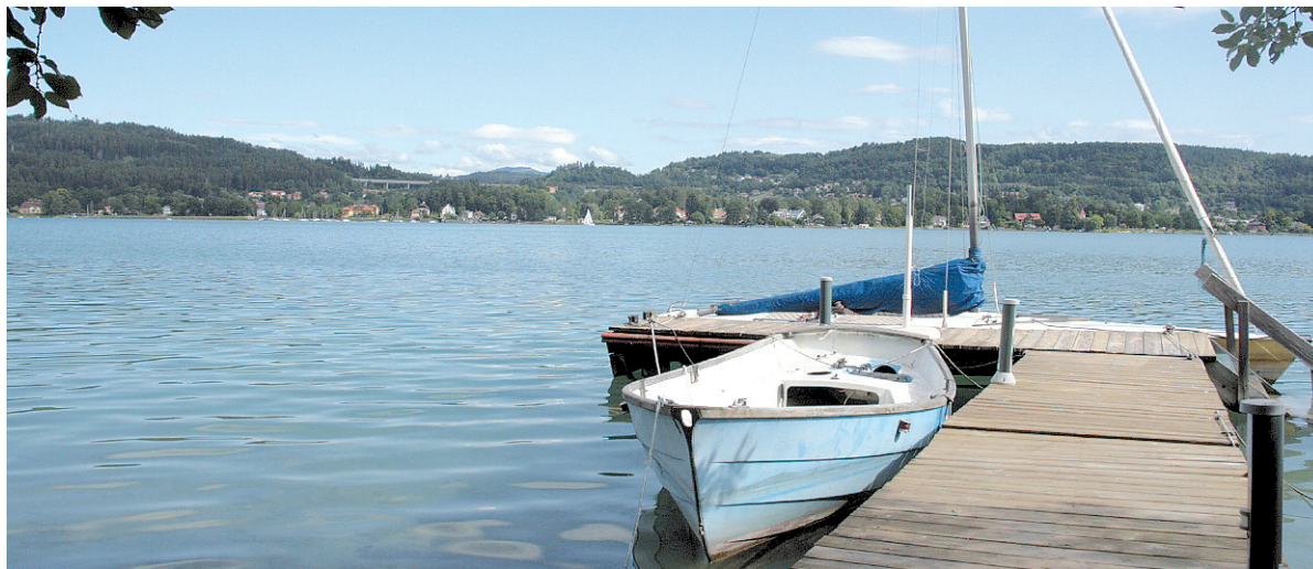
Idyll am Wasser: So beschaulich geht es nicht immer und überall am Wörthersee zu.

Die Preise klettern aber da wie dort in lichte Höhen – Seegrund-